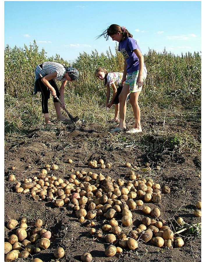
# gnh211010310 Russia, Agriculture